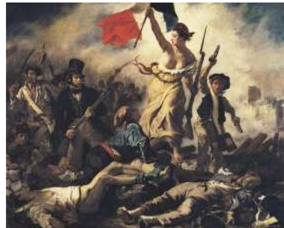
La Liberté guidant le peuple, tableau d'Eugène Delacroix, 1830.

L'Histoire de la République a été aussi marquée par plusieurs textes fondateurs : le La Déclaration des Droits de l'Homme et du Citoyen (1789, « Les Hommes naissent et demeurent libres et égaux en droits ») ; le Constitution de la Vème République (1958, « La France est une République indivisible, laïque, démocratique et sociale ») ; le loi sur la séparation des Eglises et de l'Etat (1905, principe de la laïcité). On peut aussi ajouter le traité de Maastricht (1992) qui permet à chaque citoyen français de bénéficier aussi d'une citoyenneté dans l'Union Européenne (circulation, installation, travail...).